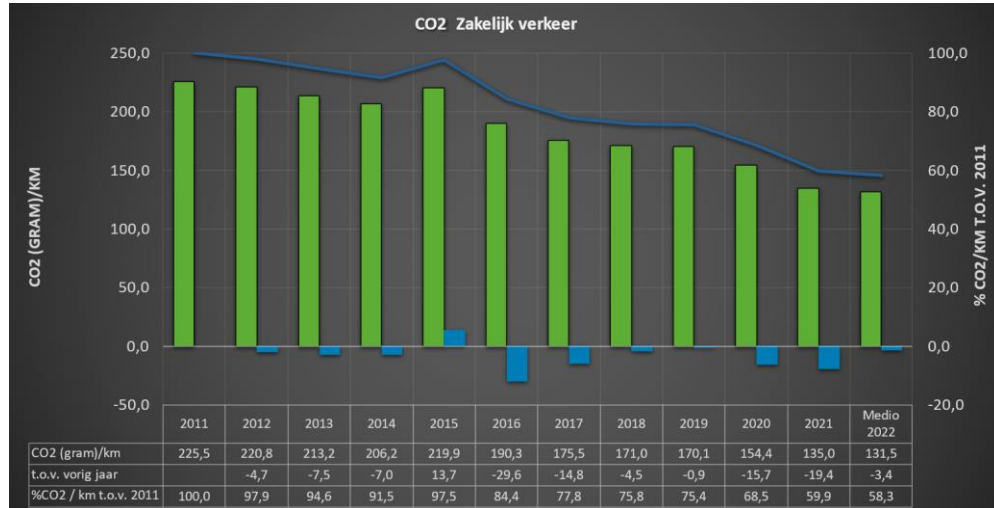
Figuur 1: Ontwikkeling CO2 zakelijk verkeer

De doelstelling tot medio 2022 is ruimschoots behaald, met een daling van 1,6 procentpunt ten opzichte van de voorgaande 12 maanden. Bij toegenomen aantallen gereden kilometers worden gecompenseerd door het grotere aandeel elektrische auto's.